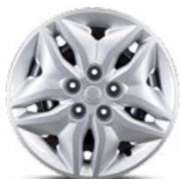
16" felgi stalowe z kołpakami (205/65)