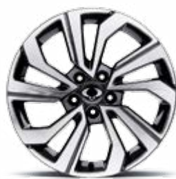
18" felgi aluminiowe "diamentowe" (215/50)