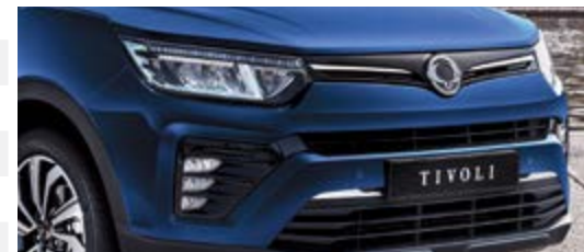
Światła mijania/drogowe LED