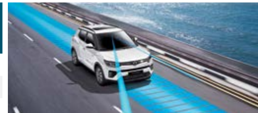
LDWS/LKAS – asystent pasa ruchu