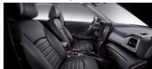
Tapicerka skórzana w kolorze czarnym