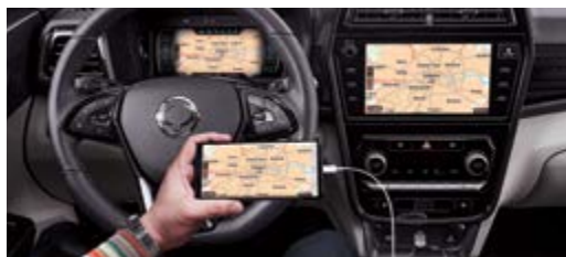
Dual Navi/ Android Auto/ Apple CarPlay