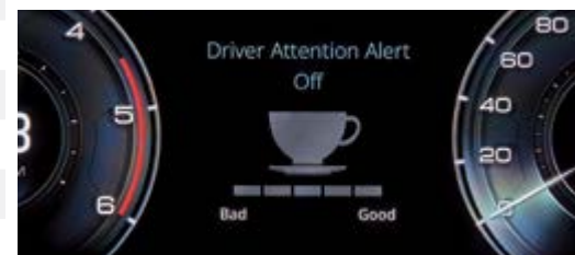
DAA – asystent zmęczenia kierowcy