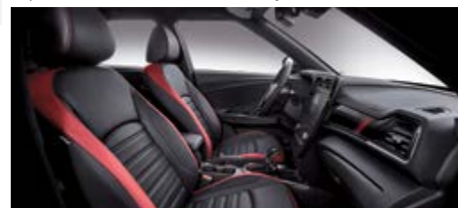
Tapicerka skórzana w kolorze burgund