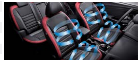
Wentylowane fotele z przodu