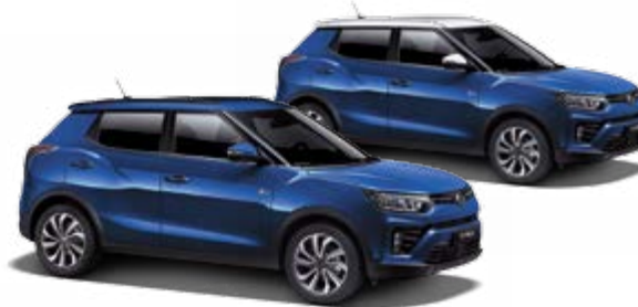
Dandy Blue (metal.)