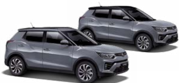
Platinum Gray (metal.)