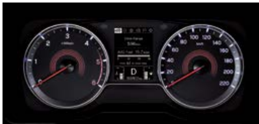
3,5" LCD – wyświetlacz komputera pokładowego