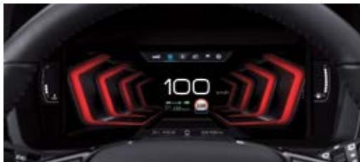
10,25" wyświetlacz LCD HD