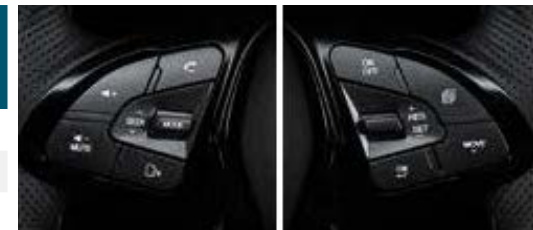
Tempomat i zestaw głośnomówiący