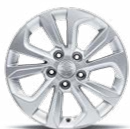
16" felgi aluminiowe (205/65)