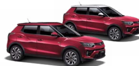
Cherry Red (metal.)