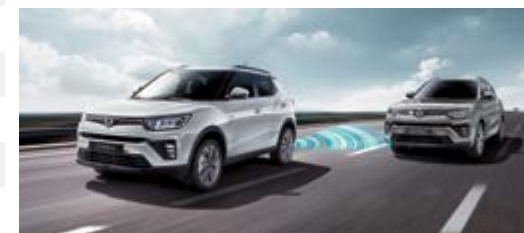
BSD - system ostrzegania o pojazdach w martwym polu lusterek