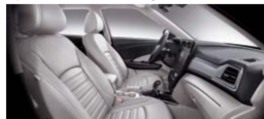
Tapicerka skórzana w kolorze jasno-szarym