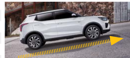
HSA – asystent wjazdu na wzniesienia