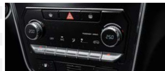
Klimatyzacja automatyczna dwustrefowa