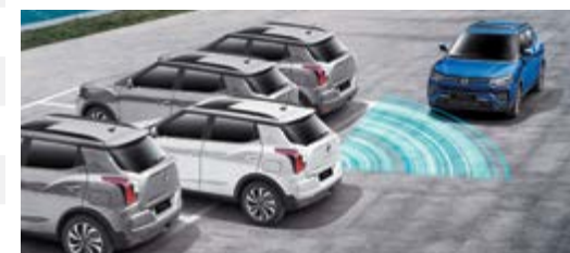
RCTA – radar ruchu poprzecznego