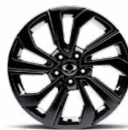
18" felgi aluminiowe czarne "diamentowe" (215/50)