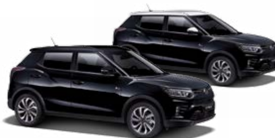
Space Black (metal.)